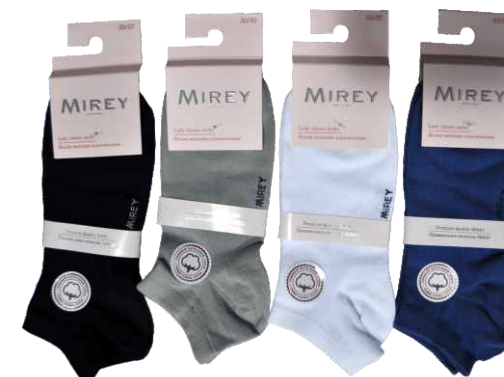
BLACK L.GREY WHITE JEANS