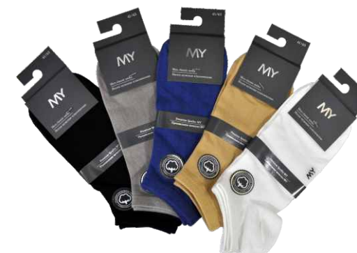
BLACK L.GREY JEANS BEIGE WHITE

Цвета: beige, black, jeans, l.grey, white