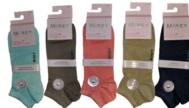
MINT TABACCO ROSA GOLD SAND JEANS

Цвета: gold sand, jeans, mint, rosa, tabacco