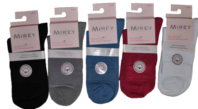
BLACK L.GREY JEANS CORALLO WHITE

Цвета: black, corallo, jeans, l.grey, white